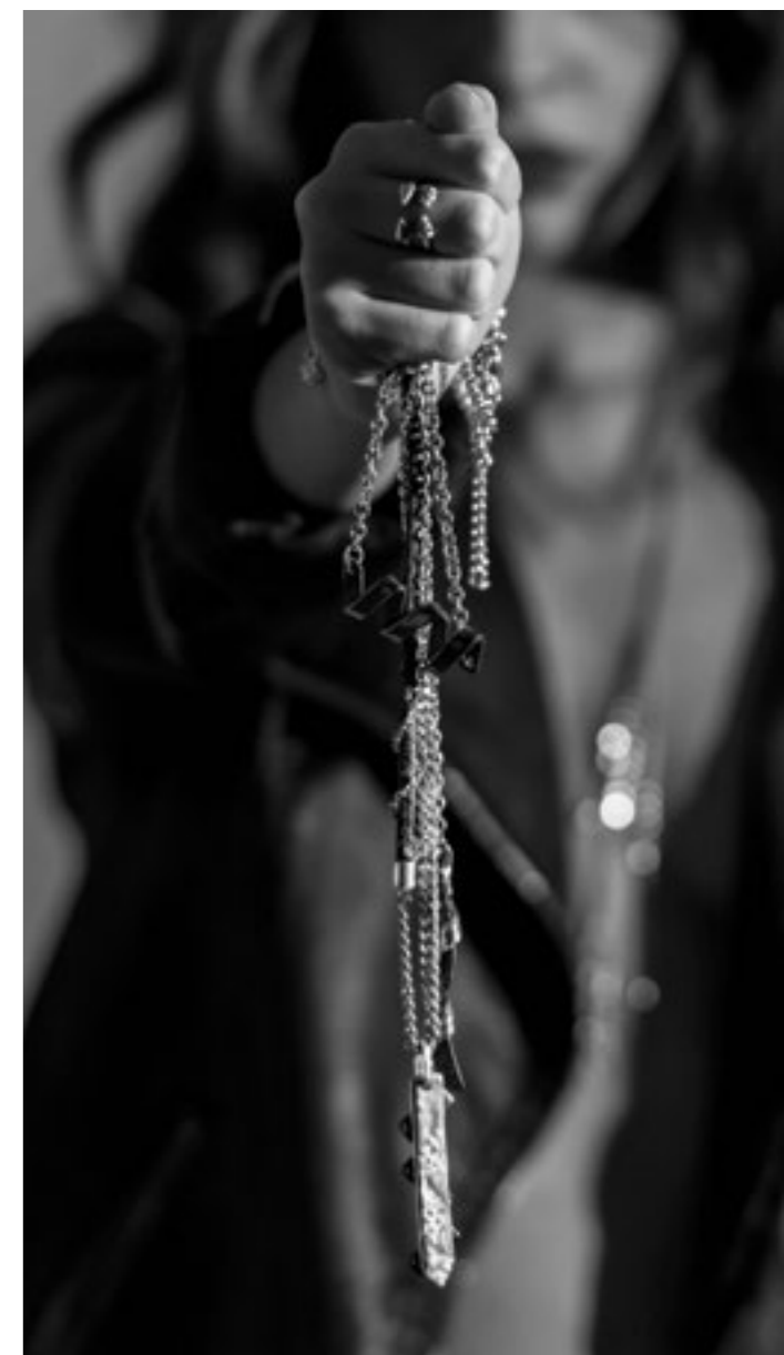
Текст: «Искусство жить».

Каждый его творческий день – это жизнь в соответствии с ожиданиями клиентов со всего мира, которых с каждой коллекцией становится все больше. Его бренд представляет услуги и дает великолепную возможность получить уникальные вещи эксклюзивного дизайна с использованием различных уникальных материалов. ///