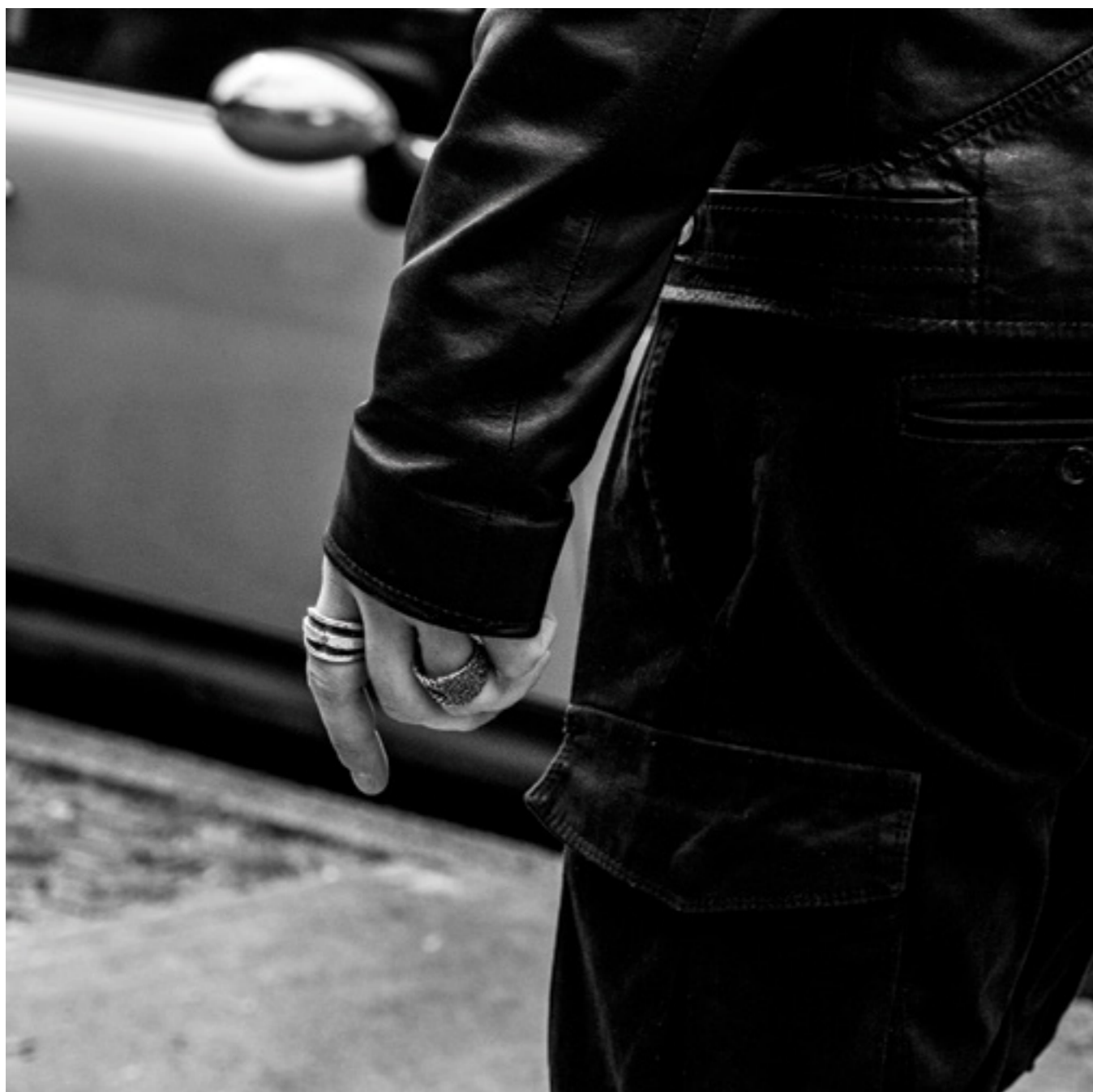
Фото: архивы пресс-служб. Текст: «Искусство Жить».

РЫНОК ЮВЕЛИРНЫХ ИЗДЕЛИЙ В ОСНОВНОМ СОСТАВЛЯЮТ КОЛЛЕКЦИИ ДЛЯ ЖЕНЩИН, ХОТЯ В ПОСЛЕДНЕЕ ВРЕМЯ ВСЕ БОЛЬШЕ МУЖЧИН ПРОЯВЛЯЮТ ИНТЕРЕС К УКРАШЕНИЯМ, ОСОБЕННО К КОЛЬЦАМ. /ANTONIO CANNIZZO/